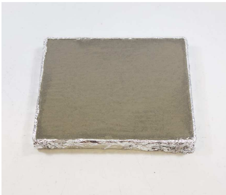
A001: Velosit SC 244

Hinweis: Die Untersuchungsergebnisse beziehen sich ausschließlich auf den vorgelegten Prüfgegenstand. Der Bericht verliert umgehend seine Gültigkeit bei Änderungen der Zusammensetzung oder des Produktionsverfahrens des Prüfgegenstandes. Eine vollständige oder auszugsweise Veröffentlichung des Prüfberichtes bedarf der Genehmigung.